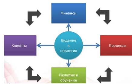
Рис. Модель ССП

– Система должна быть как можно проще, не усложнять людям жизнь слишком большим количеством показателей. Выбрать только те показатели, достижение которых может привести к большим результатам, значительно увеличить авторитет компании.